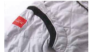
肩から脇にストレッチ素材を採用することで、 肩まわりの操作性の自由度を高めている