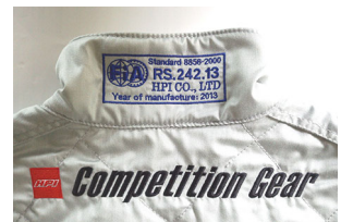
国際格闘式レースなどでも着用できる、 FIA 規格公認のラベル