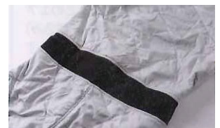
腰背部にもストレッチ素材。着座状態で スーツの遊びをなくしつつフィット感も 最適化されている