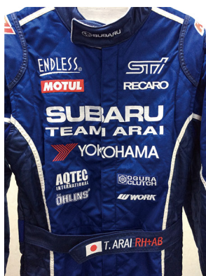
※特注カラー + プリントロゴ入り