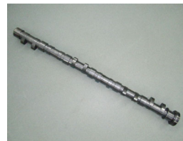
WPC 処理® カムシャフト