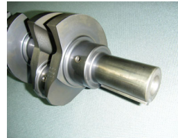
WPC 処理® クランクシャフト