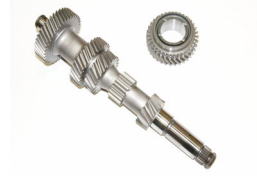
WPC 処理® JZX100