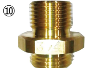
アタッチメント取付け側

※エレメント移動アタッチメントに使用するオイルフィルターはセンターボルトのネジサイズが 3/4-16UNF、Oリングサイズが φ65相当のものを使用してください。