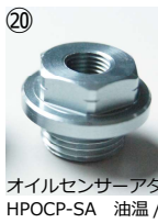
オイルセンサーアダプター (1/8PT) HPOCP-SA 油温/油圧取出し用