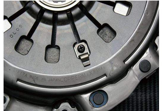
高圧着タイプ専用カバー