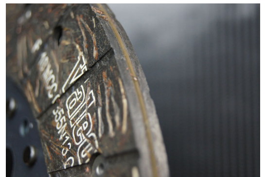
強化メタルバックプレート