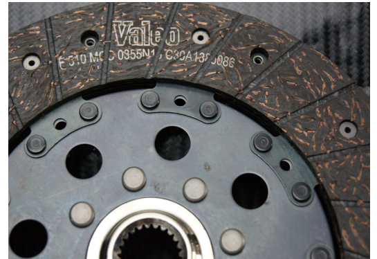
ソリッドタイプディスク