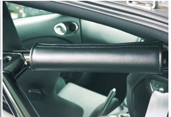
マジックテープにて取付